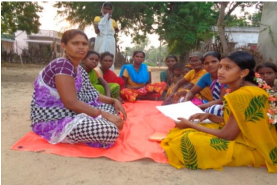
Comité de parents