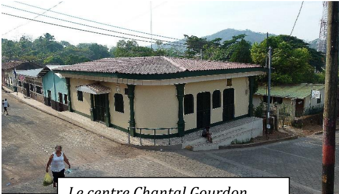
Le centre Chantal Gourdon (actuellement fermé)