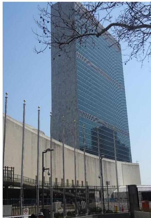
Le bâtiment siège de l'ONU, à New-York.

Ces dix-sept objectifs intègrent aux objectifs du Millénaire pour le développement définis en 2000, de nouvelles préoccupations telles que les changements climatiques, la paix et la justice, entre autres priorités.