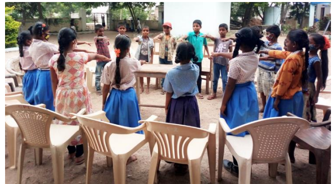
Le parlement des enfants