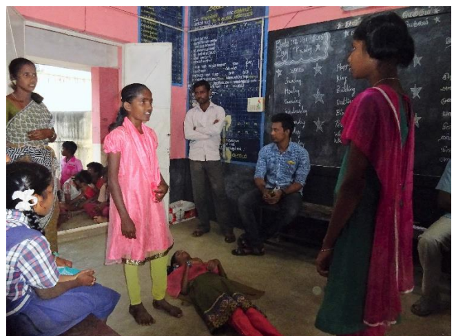
Education à la santé par le théâtre