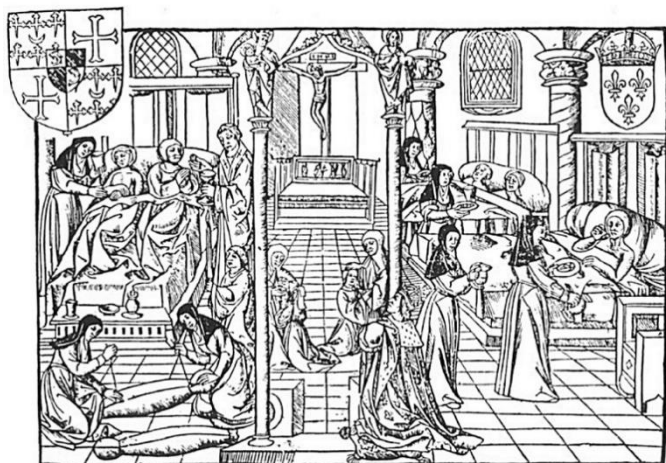
Un hôpital au Moyen-âge

fondés par de riches laïcs qui, en plus d'aider, font don de leurs biens. La plus connue est sans doute l'institution des Hospices de Beaune, fondée par le Chancelier Rolin en 1443. Le produit annuel des ventes aux enchères de sa production vinicole est encore aujourd'hui reversé à des œuvres de charité.