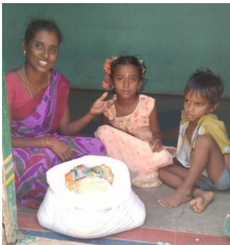
Distribution de nourriture pendant le confinement