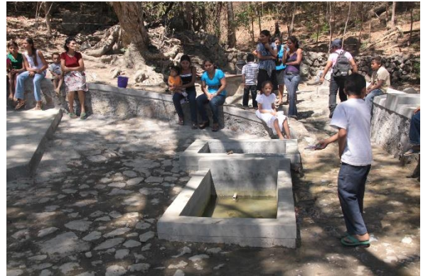
Travaux d'adduction d'eau