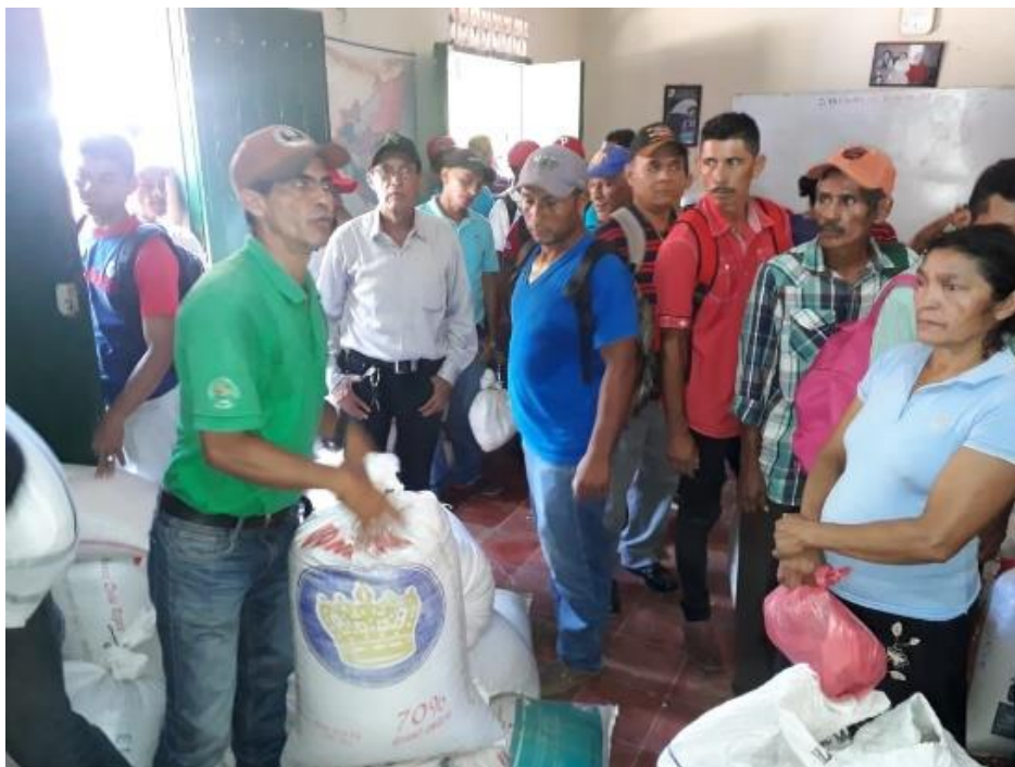
Distribution de semences en soutien aux paysans confrontés à la sécheresse Cinco-Pinos (Nicaragua)

Cela peut aller jusque des représailles à l'égard des membres d'une mission humanitaire, notamment dans les pays où il y a un engagement militaire de la France, Des décès sont régulièrement à déplorer.